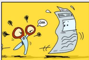
Illustration L'Hebdo des petits Citoyens

L'Hebdo des Petits citoyens, l'hebdo d'opinion des 7-11 ans, consacre la « Une » de son numéro du 1er mai à la journée internationale de la liberté de la presse. Ce numéro, ainsi que les autres, sont téléchargeables gratuitement sur le site des Petits Citoyens.