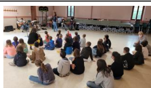
Répétition – école de Génissieux