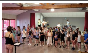
Enregistrement vidéo et audio – école de Crozes Hermitage