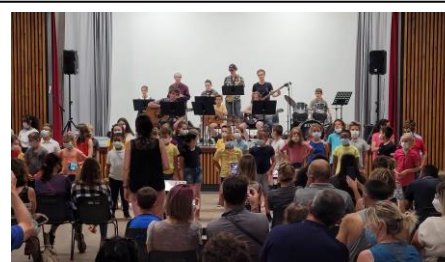
Restitution publique – école de Claveyson