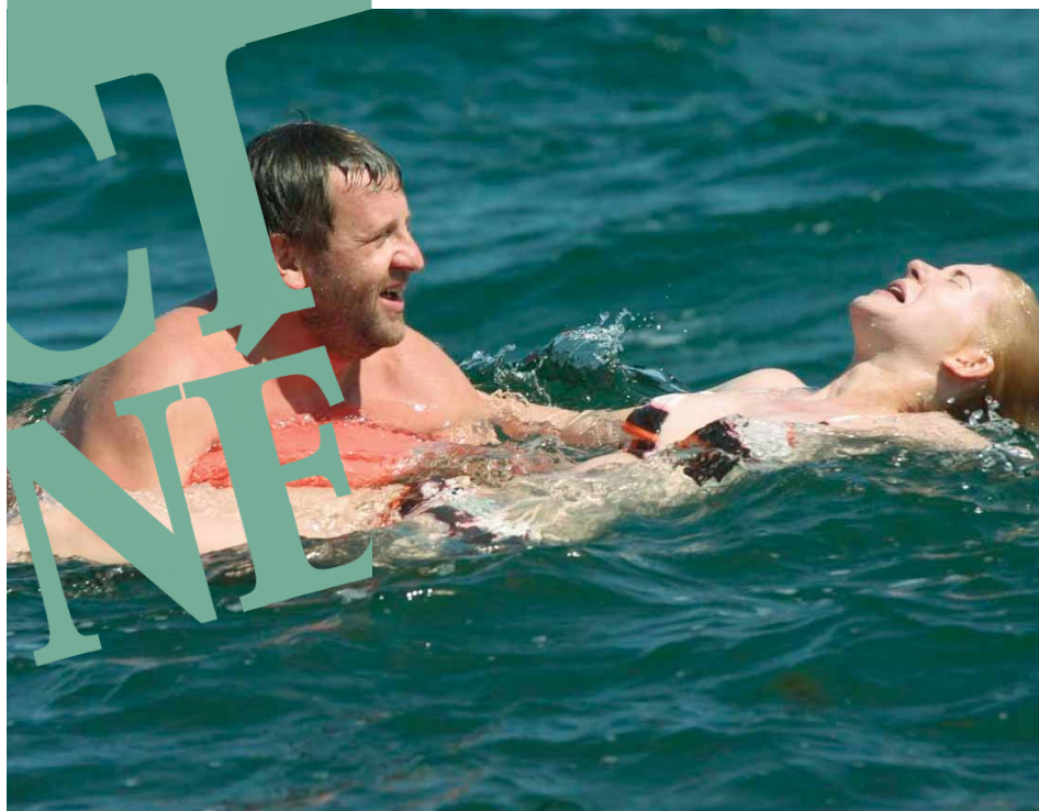
Vagues d'Adrian Sitaru, Prix spécial du jury, édition 2008

Cinéma Les Amphis Rue Pierre Cot 69120 Vaulx en Velin Tél. : 04 78 79 17 29 Fax : 04 78 79 17 50 amphis@vaulx.sitv.fr vaulxfilmcourt.com