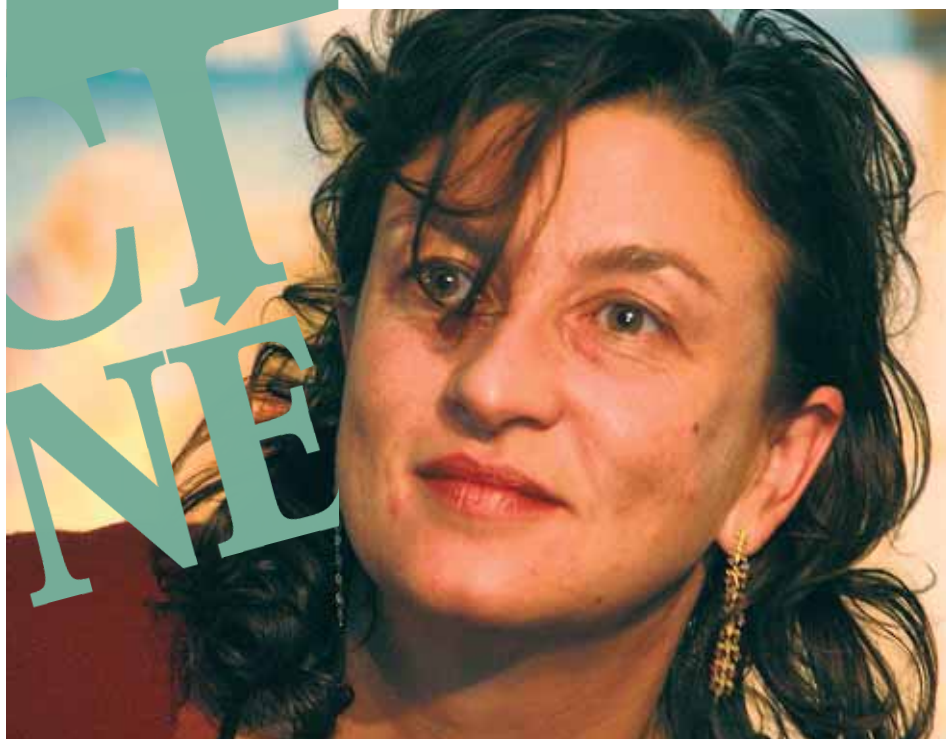
Noémie Lvovsky, lors de l'édition 2007

Association Grand Écran La Maison de l'image 9, boulevard de Provence 07200 Aubenas Tél. : 04 75 89 04 54 Fax : 04 75 35 58 60 maisonimage@wanadoo.fr www.maisonimage.eu