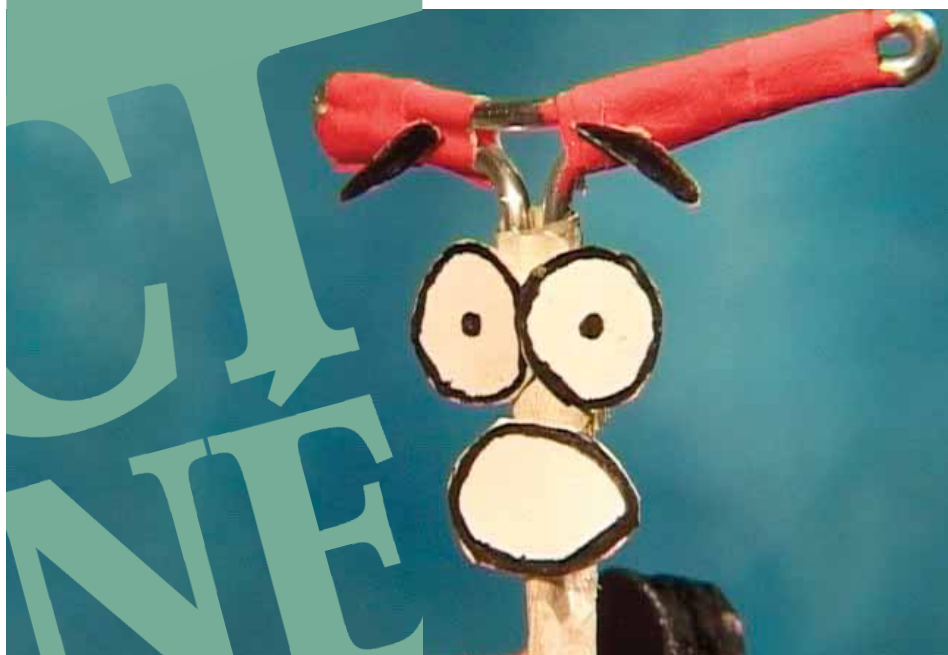
Quasimoto© L'Équipée, film tourné à la Maison des adolescents de Valence