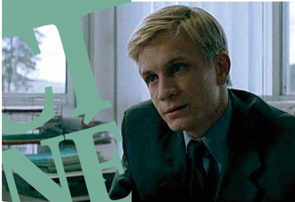
Violence des échanges en milieu tempéré de Jean-Marc Moutout

Violence des échanges en milieu tempéré fait partie des 160 films coproduits par la Région Rhône-Alpes depuis la création en 1991 de Rhône-Alpes Cinéma.