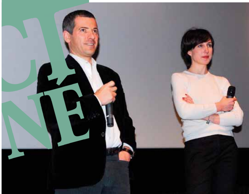
Bruno Putzulu et Elsa Zylberstein lors de l'édition 2008

Cinéma les Alizés 214, av Franklin Roosevelt BP 63 69672 Bron Cédex Tél. : 04 78 41 05 55 Fax : 04 78 26 23 68 info@cinemalesalizes.com www.cinemalesalizes.com