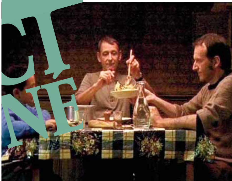
Le Mozart des pickpockets de Philippe Pollet Villard, Prix du Public 2007

Association pour le cinéma Bureau du Festival 37 rue Colin 69100 Villeurbanne Tél. : 04 37 43 05 88 / 87 Fax : 04 78 94 95 40 mediascol@wanadoo.fr www.lezola.com