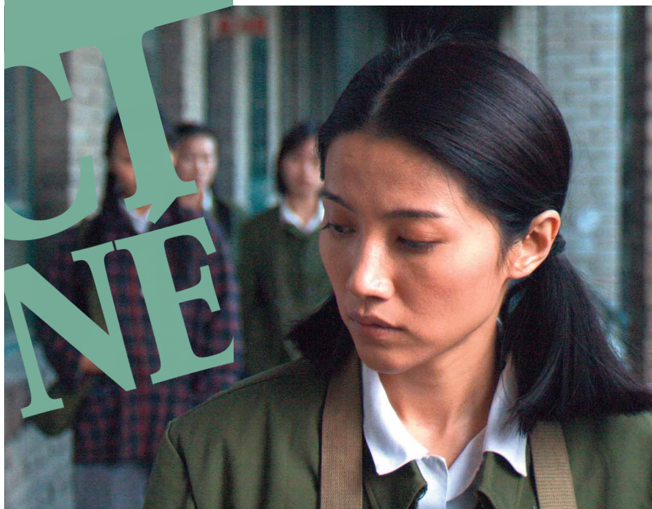
Teeth of love de Zhuang Yuxin, Grand Prix du Festival 2008

Festival International du Premier Film Maison des Jeunes et de la Culture Avenue Jean Jaurès 07100 ANNONAY Tél. : 04 75 32 40 80 Fax : 04 75 32 40 81 cinema@mjcannonay.org www.annonaypremierfilm.org