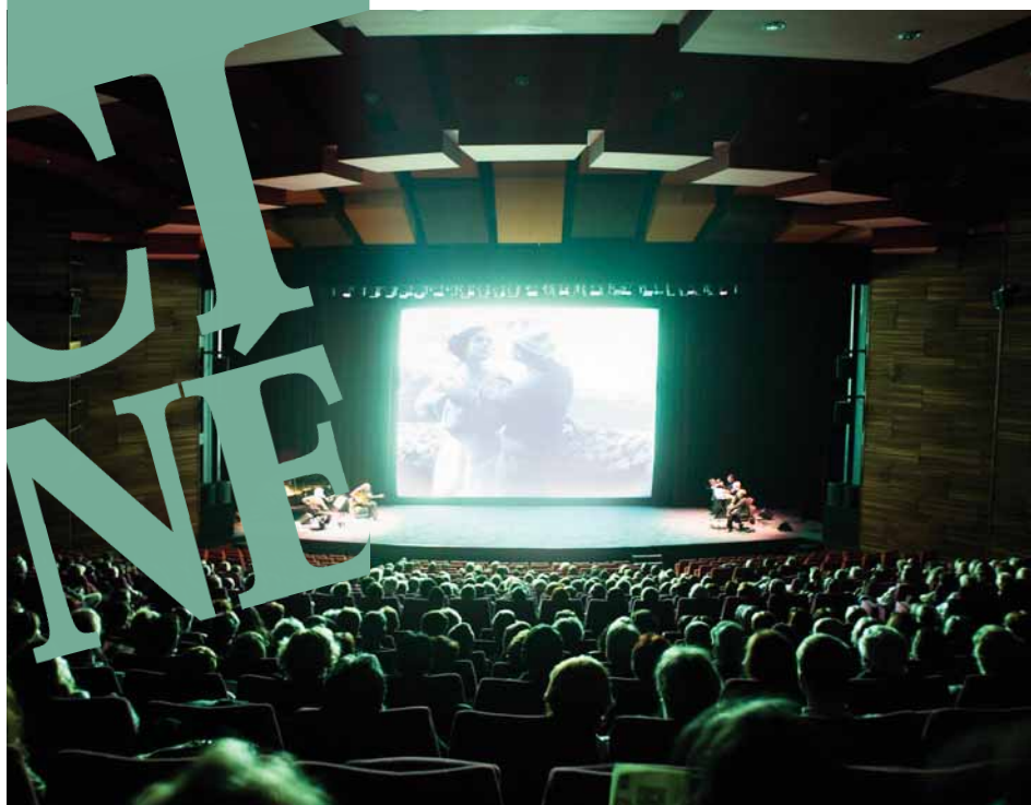
Fuoco su di me de Lamberto Lambertini Film présenté dans le cadre du Panorama 2006

Bonlieu Scène Nationale 1, rue Jean Jaurès 74007 Annecy Tél. : 04 50 33 44 11 Fax : 04 50 33 44 34 s.todeschini@annecycinemaitalien.com www.annecycinemaitalien.com