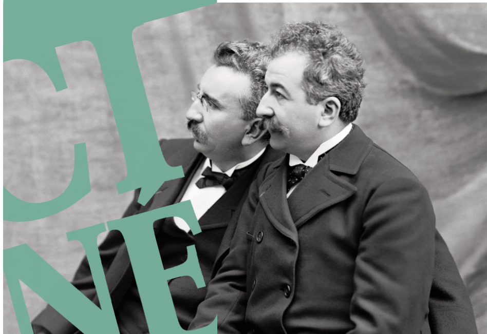
Frères Lumière, Collection Institut Lumière