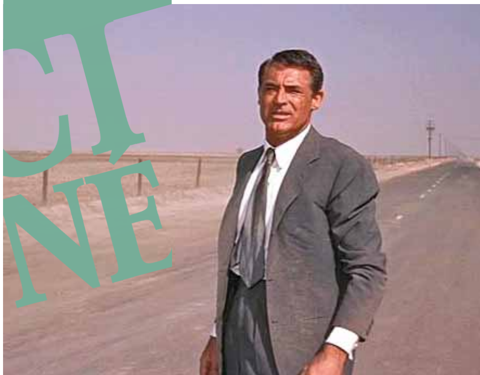
La Mort aux trousses d'Alfred Hitchcock