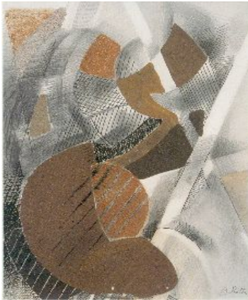
© Alfred Reth, « Rugby », Collection Musée Géo-Charles