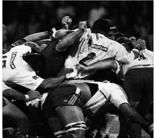
© Michel Birot, « En Mêlée », 2005 Courtesy Galerie Lucie Weill & Seligmann, Paris