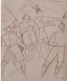
© André Lhote, « Le Rugby » Collection Musée Géo-Charles