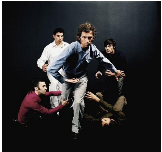
© Édouard Levé, série « Rugby », 2002 Courtesy Galerie Loevenbruck, Paris